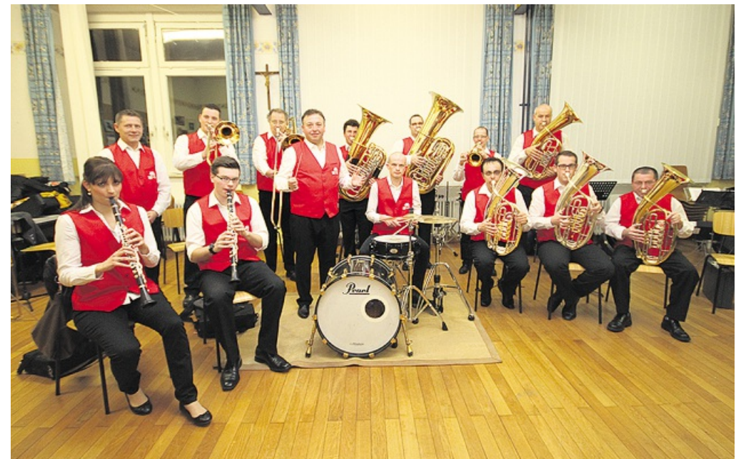
20 Vollblut-Musiker, hier bei der Probe, präsentieren ein einmaliges Repertoire.