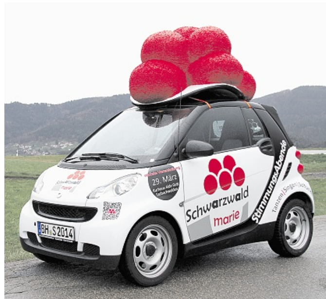
Einen Monat Smart fahren darf die schönste „Marie“.

Adresse: www.SchwarzwaldMarie.de , und per Mail an Info@SchwarzwaldMarie.de . pm